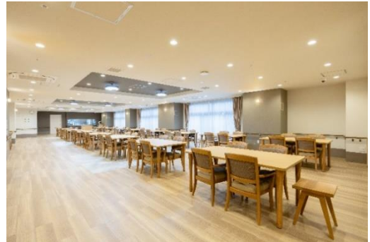
食堂兼機能訓練室