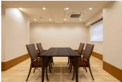
コミュニティスペース

ご利用者が地域との交流をお楽しみいただけるように、建物内にはコミュニティスペースを設けており、S OMP O流 子ども食堂や地域の方との催しで活用します。また、食堂では地域の方も参加できるイベントを 開催予定です。屋外においても、敷地内に移動スーパーやキッチンカーなどの訪問販売を誘致し、地域の方にも ご利用いただくことで、交流を深める場を増やしていきます。