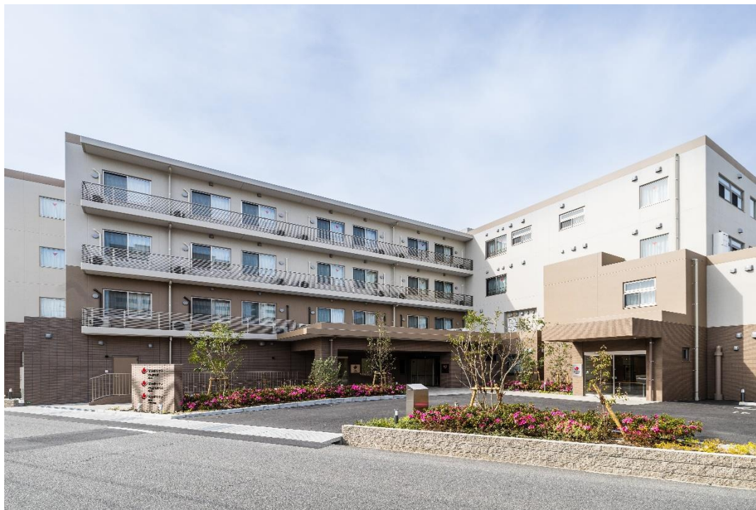
SOMPOケア そんぽの家 福山東・SOMPOケア そんぽの家GH福山東・SOMPOケア 福山東 小規模多機能