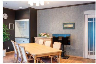
ファミリーダイニング