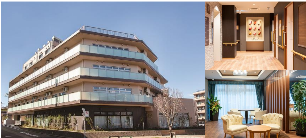
SOMPOケア ラヴィーレ堀之内

SOMPOケア株式会社（本社：東京都品川区／代表取締役社長 鷲見 隆充、以下、「当社」）は、介護付きホーム「SOMPOケア ラヴィーレ堀之内」（東京都八王子市）を同市内に新築移転します。ご入居者、職員がより快適で過ごしやすい環境を整えることを目的に、開放的で豊かな共用空間を新たに設え、3月1日にリニューアルオープンします。