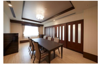
ファミリーダイニング