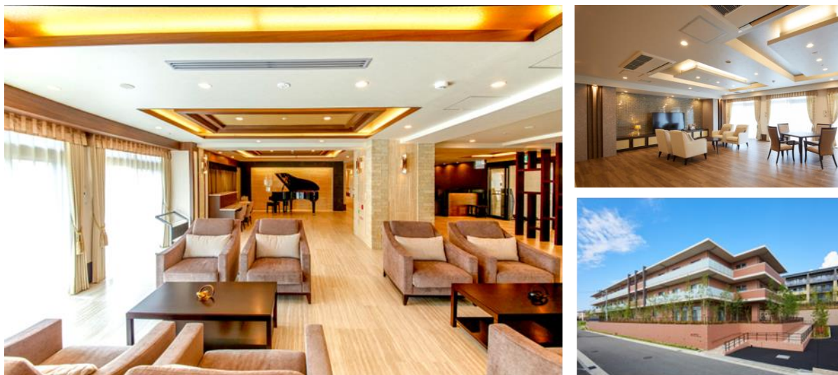
SOMPOケア ラヴィーレグラン夙川

※ 2023年3月29日付リリース 2023年10月介護付きホーム「SOMPOケア ラヴィーレグラン しゅくがわ 夙川」（兵庫県西宮市）をオープン! ( https://www.sompocare.com/uploads/2023/03/news_0329.pdf )