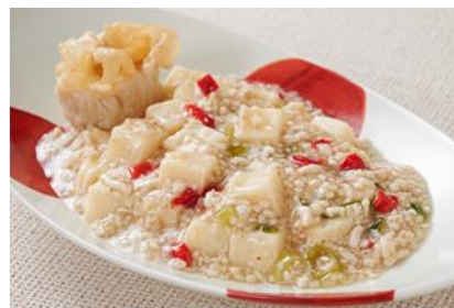
【まるやか☆白い麻婆豆腐】