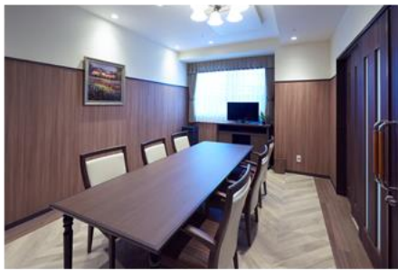
ファミリーダイニング