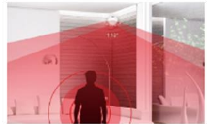
センサーシステムのイメージ