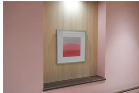
4階エレベーター前 2階はイエロー、3階はグリーン