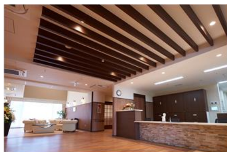
エントランスホール（受付）

1階のエントランス近くにはコミュニティスペースを設けており、地域の方々に会議や趣味など各種イベントにご利用いただけます。地域に開かれた住宅として、子供から高齢者まで、幅広い世代が交流できる場所として運営していきます。