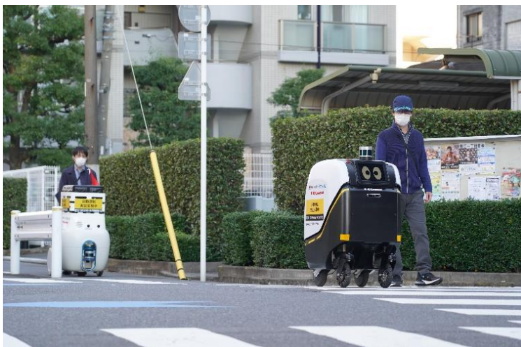
<運行管理システムにおける同時制御の様子>