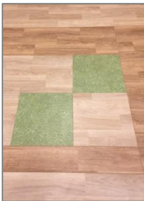
【2階 床デザインと絵画】

視線が下向きになりやすい高齢者の方にも認識できるよう、階ごとに床のマーク表示を変えています。また、廊下の絵画を見て、ご自身の居室があるフロアかどうか区別することができます。