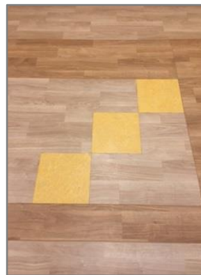
【3階 床デザインと絵画】