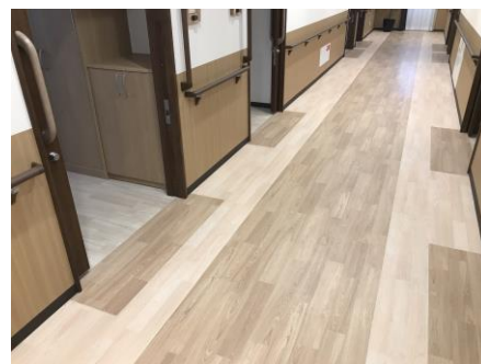
居室の前と分かりやすい、廊下の色の濃淡