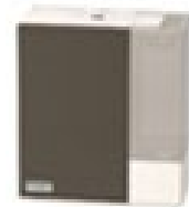
<ハイブリッド式加湿器>