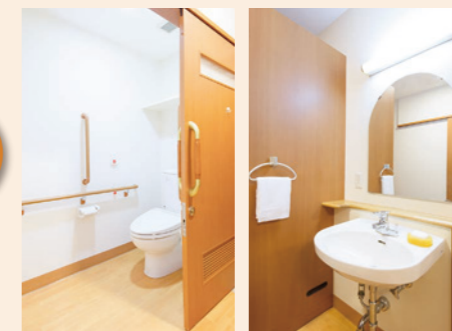
車椅子でも使いやすいトイレと洗面台