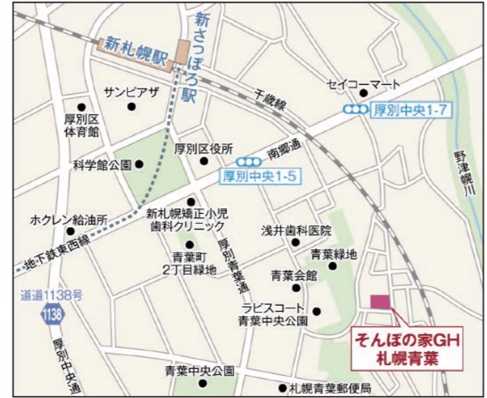
〒004-0021 北海道札幌市厚別区青葉町13-5-5

「そんなの家GH」共通施設概要 ●居室設備:洗面、他 ●共用設備:冷暖房完備、トイレ、浴室、他 ●入居対象:●札幌市にお住まいの方 ●要支援2または要介護1以上の被認定者であり、かつ認知症の診断がある方 ●自傷他害の恐れがなく少人数による共同生活を営むことに支障がない方。●常時医療機関において治療をする必要がない方 ●重要事項説明書に記載する事業所の運営方針に賛同できる方。 ●類型:グループホーム ●土地の建物の所有形態:事業主体非所有 ●居住の権利形態:利用権方式 ●利用料の支払い方法:月払い方式 ●介護保険:認知症対応型共同生活介護・介護予防認知症対応型共同生活介護 ●介護居室区分:全室個室