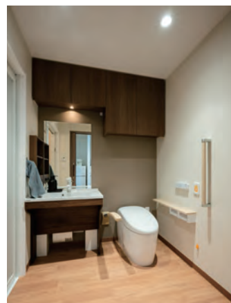
清潔感のある洗面化粧台を各室に設置