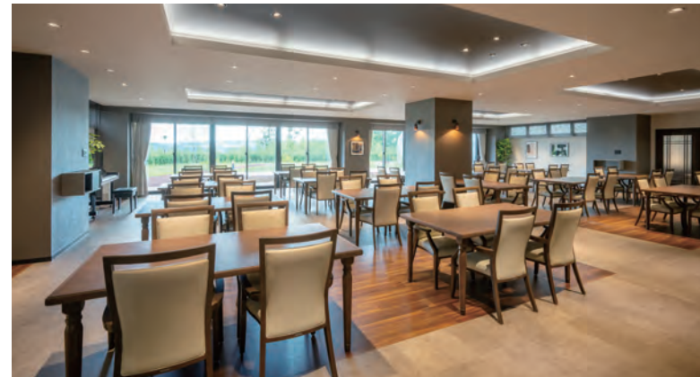
広々としたダイニング、ご入居者さまに心地よくご利用いただける共有スペース

すべての方が“わが家のようにくつろげる、充実の共用空間。 憩いの時間を過ごすラウンジや、ご家族と食事を楽しむファミリーダイニングなど、 日常的にゆとりと癒しを実感できる上質感あふれる共用空間をご用意。