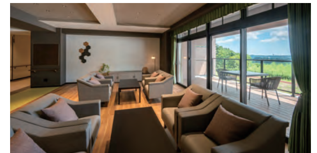
ご入居者さま同士での会話やティータイム、読書を楽しめるラウンジと開放感いっぱいのインナーバルコニー