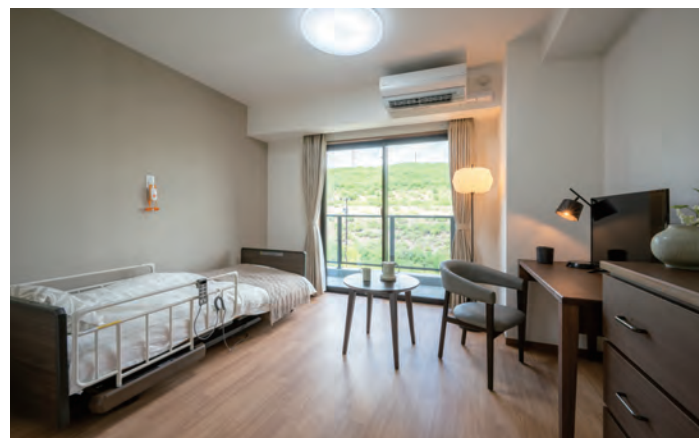
お気に入りの家具を持ち込める居室（モデルルーム）

安心してお過ごしいただけるよう、緊急コールを各室とトイレに設置し、 全居室に浴室完備。