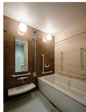
手すりなどが設置されている使いやすい浴室

昨日より今日、今日より明日と、笑顔の数がひとつでも増えていくように。 お一人おひとりにとって本当にうれしい介護をカタチにしていまいます。