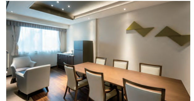
ご家族がいらしたときにお食事を楽しめるファミリーダイニング