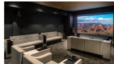
映画やスポーツ観戦など大画面で見られるシアタールーム