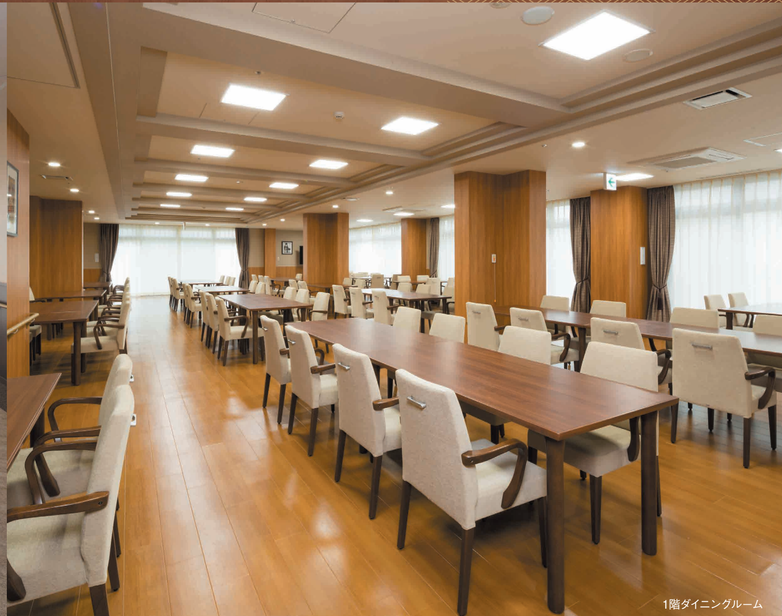
1階ダイニングルーム