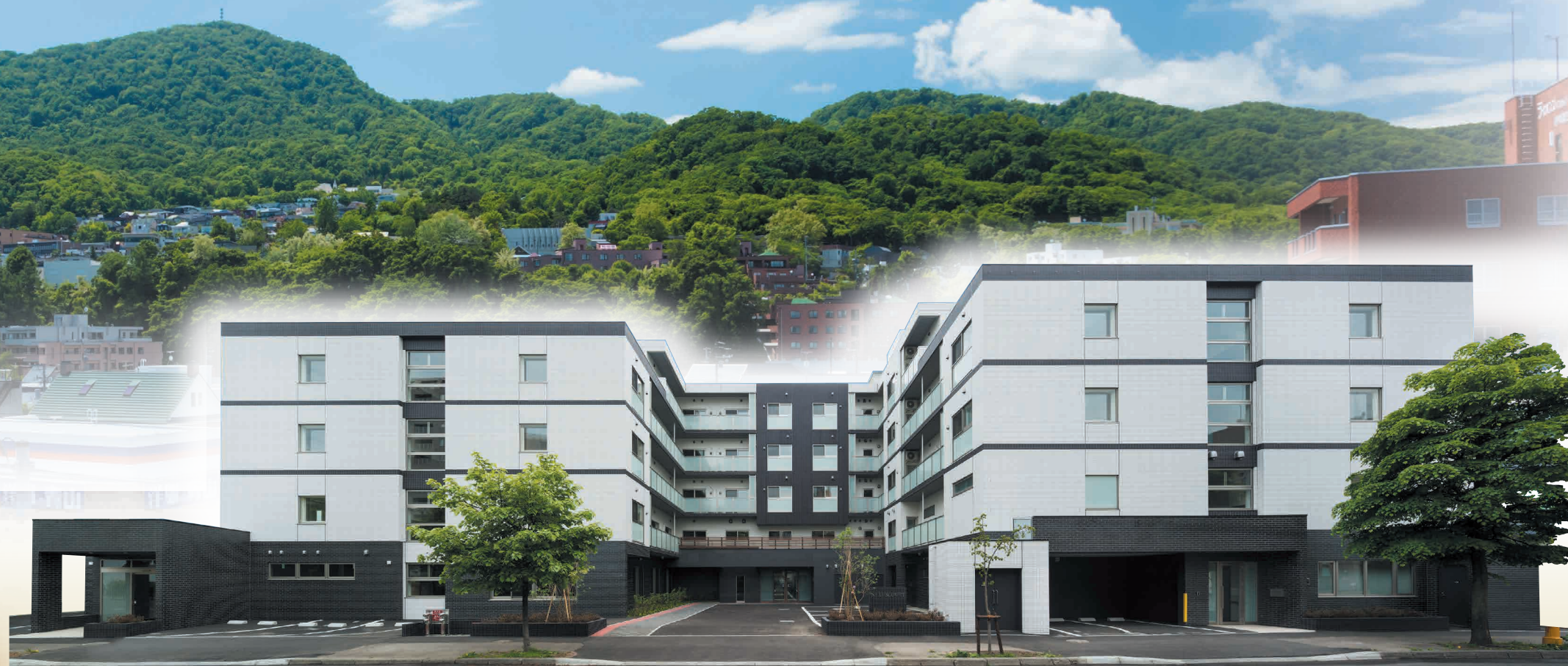
※上記の建物写真はラヴィーレジデンス旭ヶ丘の外観写真（平成29年6月撮影）にCG処理を施したものです。

一人暮らしが不安な方、介護・看護の必要な方。 終身ご入居いただくことが可能です。