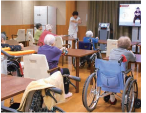
参考：ラヴィーレジデンス旭ヶ丘で行われた介護予防運動(一例)

スタッフによる介護度進行を予防するグループリハビリを導入。車いすの方でも参加していただける体操やゴムバンドを使ったセラバンド体操などを通じて、健康維持と、より質の高い生活のためのサポートにも積極的に取り組んでいます。