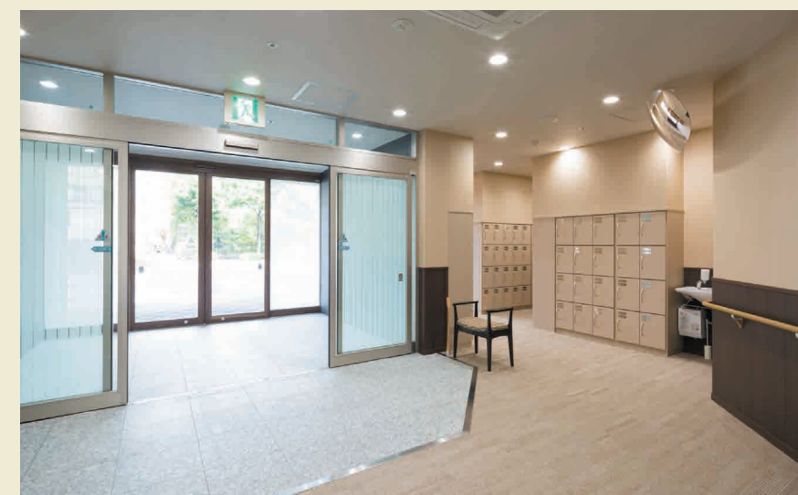
※このパンフレットに掲載している本施設の写真は平成29年6月に撮影したものです。

日々の健康についての相談や何げない会話など、いつでも気軽に立ち寄れる安心のサービスステーションです。