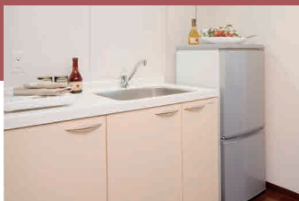
▲IHクッキングヒーター付きミニキッチン