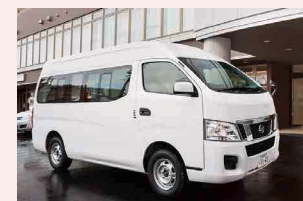
福祉車両参考写真

協力医療機関への送迎や入院中の肌着、寝巻き、タオルなどの洗濯物のお届けなど、様々なサポートを行う福祉車両(車いす対応)をご用意しています。