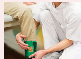
リハビリイメージ