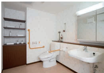
▲多機能型温水トイレ車いす対応洗面ユニット