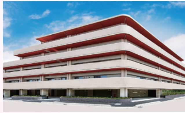
外観 ※土地・建物は賃借です。