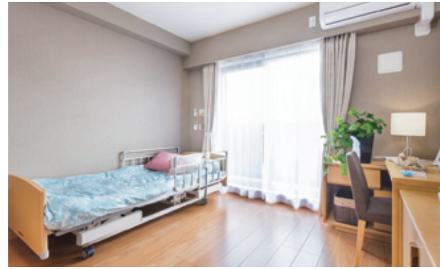
居室(モデルルーム) ※家具・調度品は含みません。