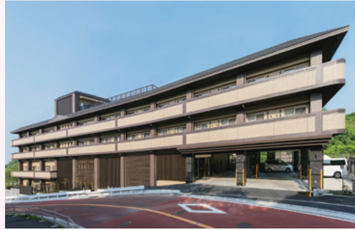
外観 ※土地・建物は賃借です。