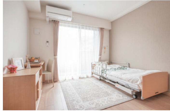
居室(モデルルーム) ※家具・調度品は含みません。