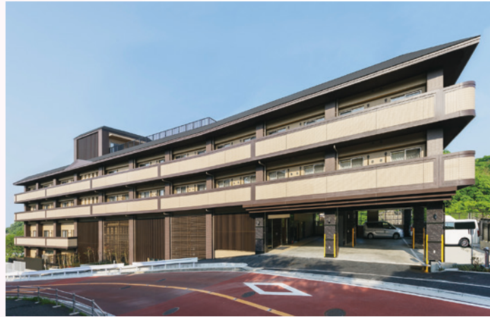
外観 ※土地・建物は賃借です。