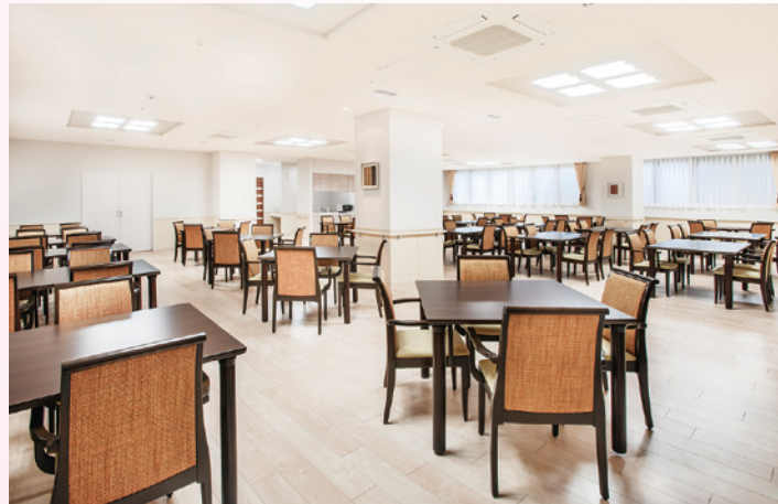
ダイニングルーム