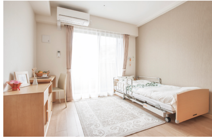
居室(モデルルーム) ※家具・調度品は含みません。