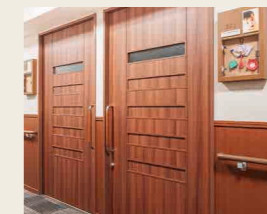
1 フリーストップ付き玄関扉