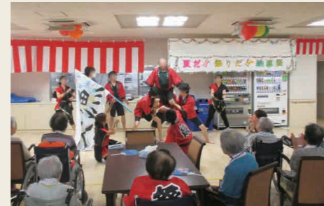
納涼祭の様子 (平成26年8月撮影)

ご入居者様のお誕生会はもとより、手作り体験や書道、音楽鑑賞、健康づくりなど、毎月多種多様なレクリエーションを実施。日々の暮らしをさらに楽しみたいだけるよう趣向を凝らしています。