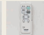
6 居室照明リモコン