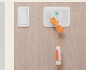
7 ケア・ナースコール