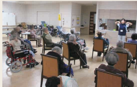
大手スポーツクラブの専門トレーナーによる介護予防体操の様子 (平成26年3月撮影)

スタッフによる介護度進行を予防するグループリハビリを導入。車いすの方でも参加していただける体操やゴムバンドを使ったセラバンド体操などを通じて、健康維持と、より質の高い生活のためのサポートにも積極的に取り組んでいます。