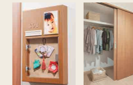
2 思い出ボックス 3 クローゼット