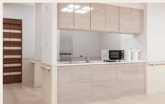
対面型システムキッチン

ご入居者様全員が揃ってお食事いただける十分な広さを確保。通常の朝昼夕のお食事の時はもちろん、日々のレクリエーションや月ごとのイベントの際には、ご家族様も招いて一緒に楽しめるスペースです。