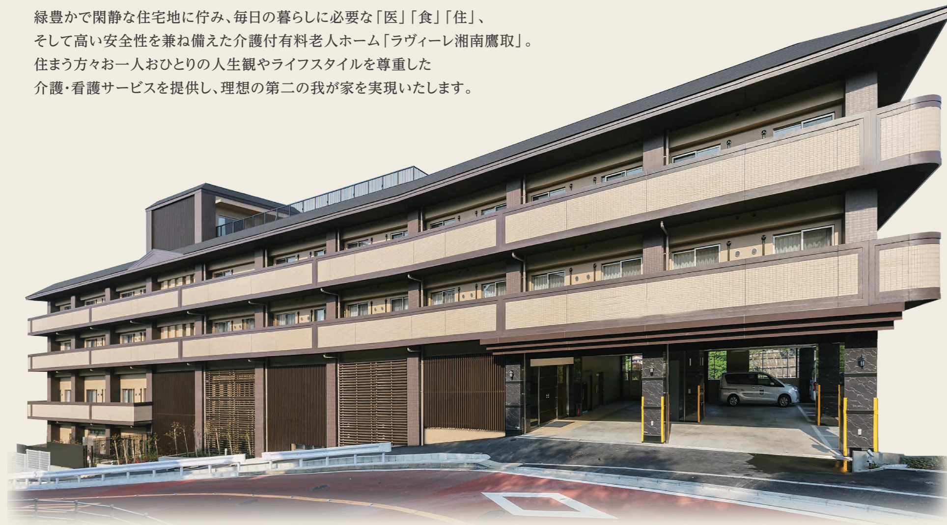
※上記の建物写真はラヴィーレ湘南鷹取の外観写真(平成25年4月撮影)にCG処理をしたものです。

緑豊かで閑静な住宅地に佇み、毎日の暮らしに必要な「医」「食」「住」、 そして高い安全性を兼ね備えた介護付有料老人ホーム「ラヴィーレ湘南鷹取」。 住まう方々お一人おひとりの人生観やライフスタイルを尊重した 介護・看護サービスを提供し、理想の第二の我が家を実現いたします。