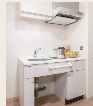
■ミニキッチン(D・Eタイプ) 二人部屋に、ミニキッチンを設置しました。また、安全に考慮し、卓上型のIHコンロを貸し出しでの対応としました。

プライバシー確保を第一に考え、お部屋はすべて個室をご用意しております。これまでお使いの家具や思い出の品をお持ちいただき、ご自分らしくお暮らしいただけます。洗面・トイレには人感センサー付照明やケア・ナースコールを設置するなど、安心して快適にお暮らしいただける居室づくりにこだわりました。