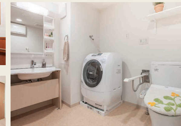
4 多機能トイレ&amp;洗面台