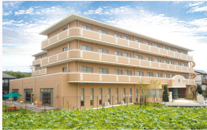
外観 ※土地・建物は賃借です。