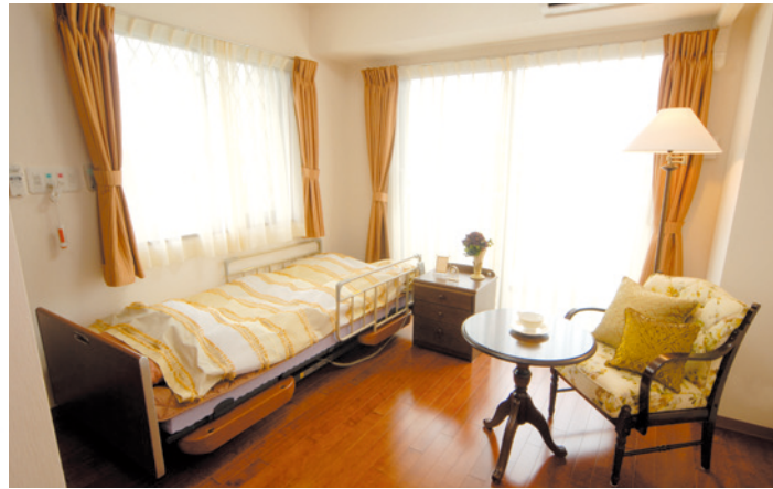
居室(モデルルーム) ※家具・調度品は含みません。