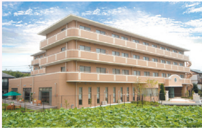
外観 ※土地・建物は賃借です。