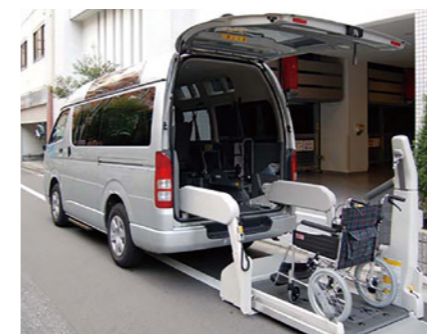
福祉車両(参考写真)

協力医療機関への送迎や入院中の肌着、寝巻き、タオルなどの洗濯物のお届けなど、様々なサポートを行う福祉車両(車いす対応)をご用意しています。