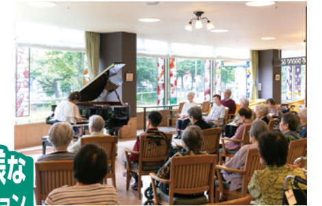
ピアノ演奏会の様子

ご入居者さまのお誕生会はもとより、手作り体験や書道、音楽鑑賞、健康づくりなど、毎月多種多様なレクリエーションを実施。日々の暮らしをさらにお楽しみいただけるよう趣向を凝らしています。