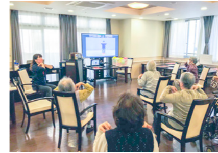
オンラインアクティビティ体操の様子

スタッフによる介護度進行を予防するグループリハビリを導入。車いすの方でも参加していただける体操やゴムバンドを使ったセラバンド体操などを通じて、健康維持と、より質の高い生活のためのサポートにも積極的に取り組んでいます。