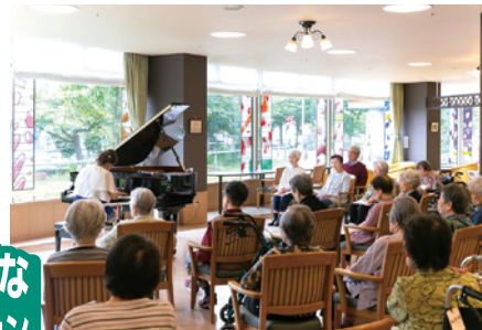
ピアノ演奏会の様子

ご入居者さまのお誕生会はもとより、手作り体験や書道、音楽鑑賞、健康づくりなど、毎月多種多様なレクリエーションを実施。日々の暮らしをさらにお楽しみいただけるよう趣向を凝らしています。