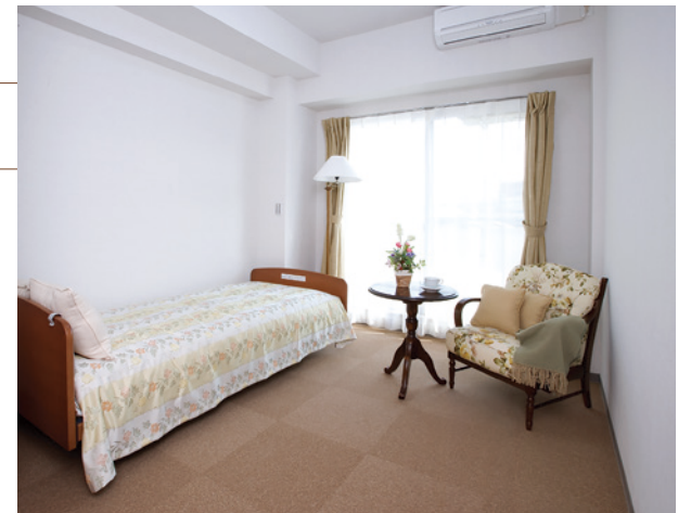
居室Bタイプ(モデルルーム)