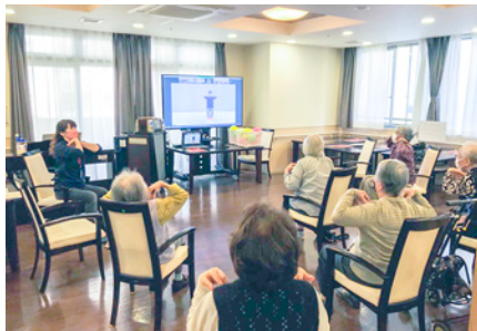
オンラインアクティビティ体操の様子

スタッフによる介護度進行を予防するグループリハビリを導入。車いすの方でも参加していただける体操やゴムバンドを使ったセラバンド体操などを通じて、健康維持と、より質の高い生活のためのサポートにも積極的に取り組んでいます。