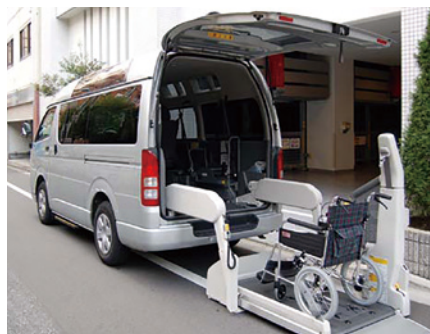
福祉車両(参考写真)

協力医療機関への送迎や入院中の肌着、寝巻き、タオルなどの洗濯物のお届けなど、様々なサポートを行う福祉車両(車いす対応)をご用意しています。