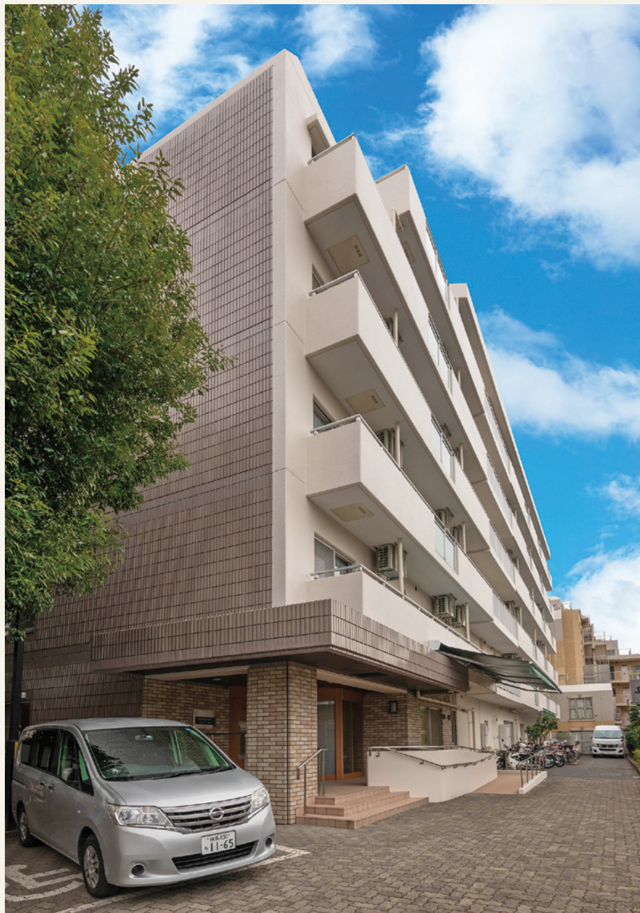
そんぽの家 練馬外観

この新しい「住まい」で新たに結ばれた絆を大切に守り続け、生活を共にしながらより一層深めていきたい。そのために皆さまの個性と誇りを尊重し、心の通った家庭的なケアサービスをお届けしていくことが、私たちの使命です。そして皆様の第二の人生がより輝くものとなるよう、生涯のパートナーとして、心を込めてご支援してまいります。