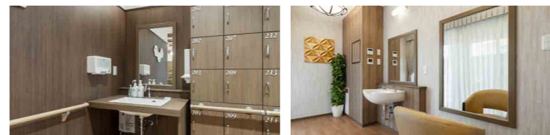
入ってすぐ手洗い・うがい手指消毒可能なスペース