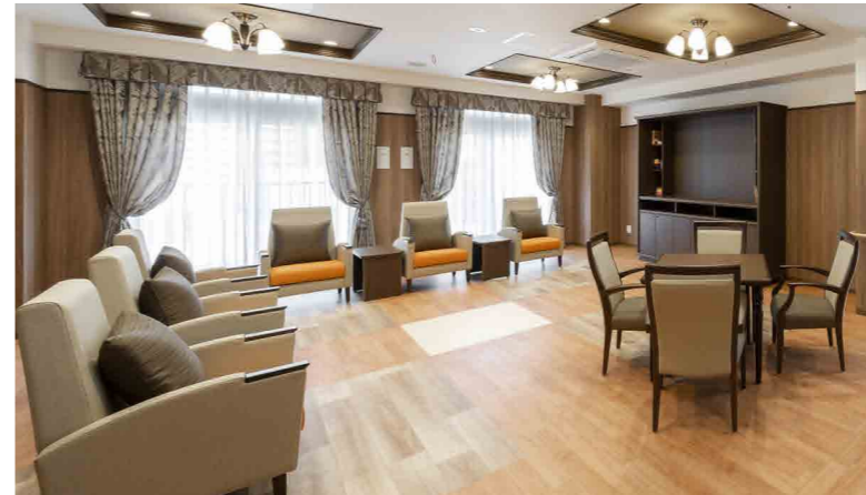
ご入居者さまに心地よくご使用いただける共用スペース

ゆったりとしたダイニング（食堂）や思い思いに過ごせるラウンジなど、日常的にゆとりと癒しを実感できる共用空間・設備をご用意しています。