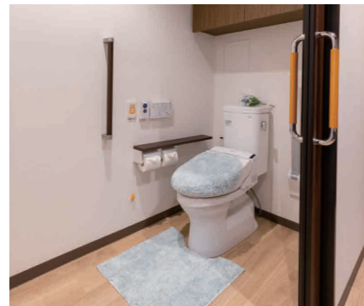
広々としたトイレを全室に設置