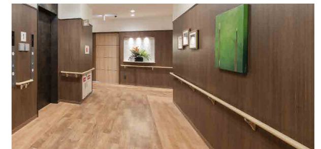
手すりを多く設置した広く明るい廊下

昨日より今日、今日より明日と、笑顔の数がひとつでも増えていくように。 お一人おひとりにとって本当にうれしい介護をカタチにしていまいます。