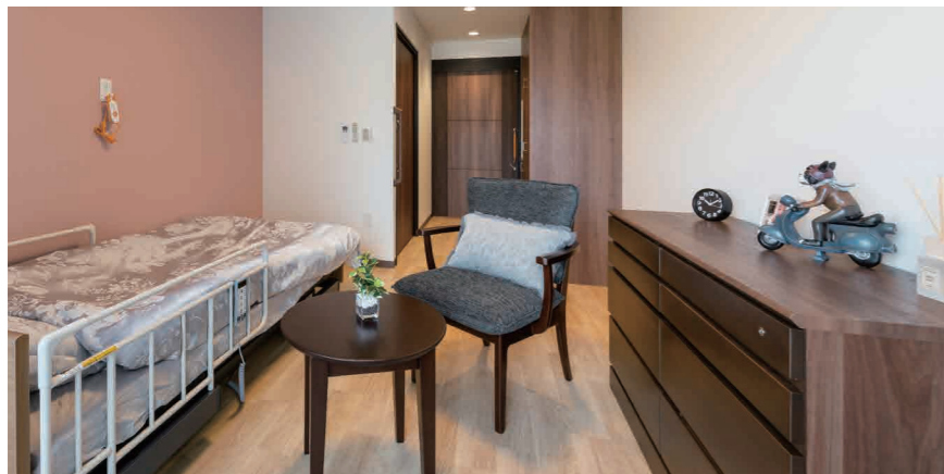
お気に入りの家具を持ち込める居室（ラヴィーレ池田モデルルーム）

安心してお過ごしいただけるよう、緊急コールを各室とトイレに設置し、車椅子のご利用にも配慮しています。