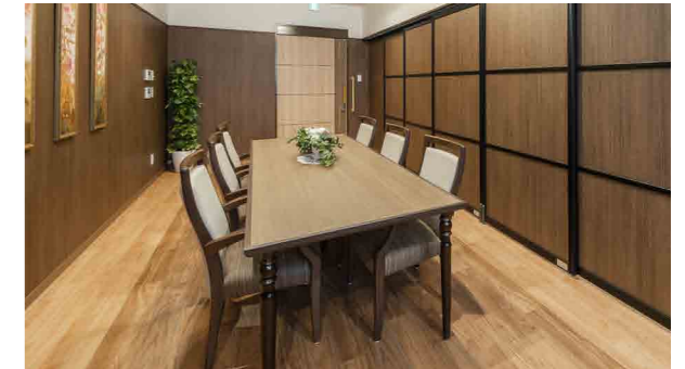
ご訪問されたご家族と和やかなひとときを過ごせるファミリーダイニング