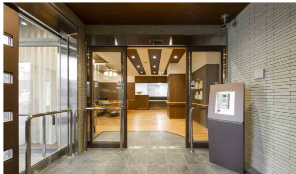
ここに住まう方々やご家族を出迎えるエントランス ※外観写真・室内写真は2022年3月撮影／事業主体所有

2015年に文化庁の芸術創造都市として選出された豊中市にある「SOMPOケア ラヴィーレ豊中」。歴史もあり健やかな営みの環境にあるこの街で「心身の健やかな生活を送っていただきたい」そんな思いを込めて、みなさまの生活をさらに豊かにサポートさせていただきます。散歩したくなるような街の懐かしい風景の中でゆっくりとお過ごしください。