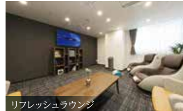
リフレッシュラウンジ