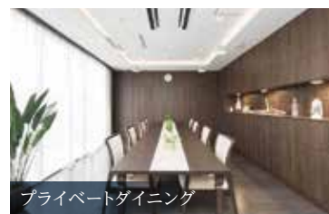
プライベートダイニング