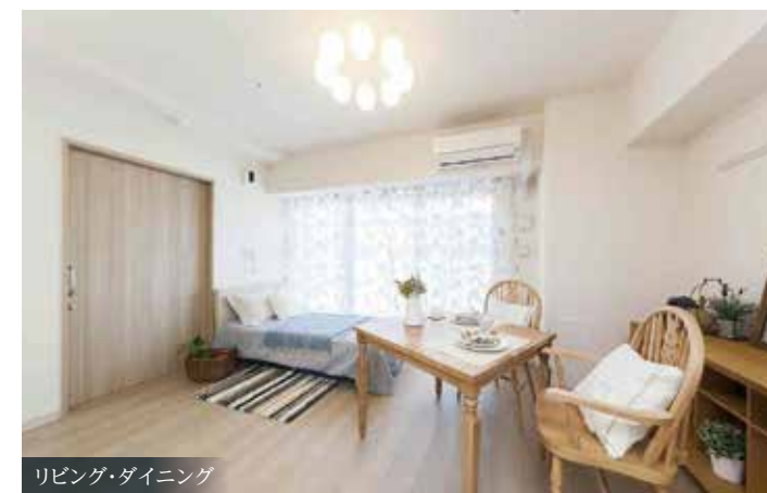
リビング・ダイニング

1Rの居室にはキッチンをはじめ、浴室、洗濯機置き場も完備。また、全居室に「人感センサー」を標準装備。