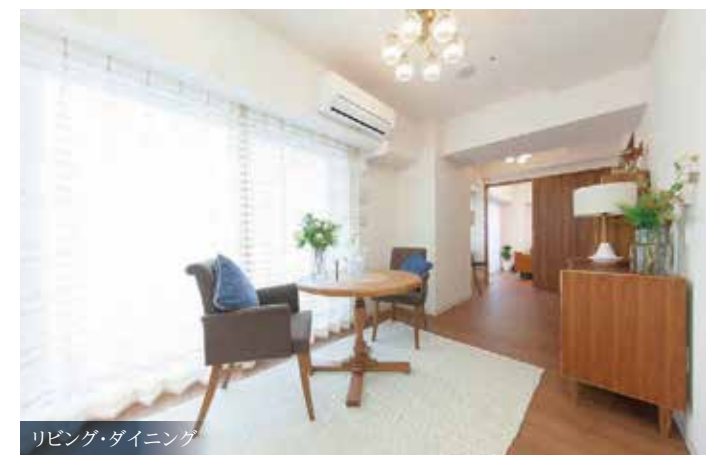
リビング・ダイニング