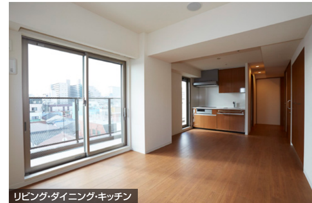
リビング・ダイニング・キッチン