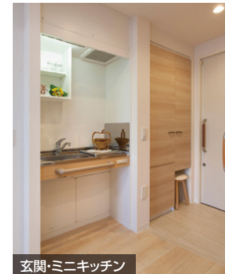
玄関・ミニキッチン