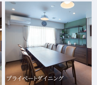
プライベートダイニング