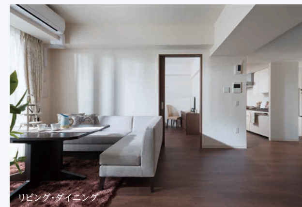
リビング・ダイニング

2LDKの居室にはキッチンをはじめ、浴室、洗濯機置き場も完備。また、全居室に「人感センサー」を標準装備しているので、24時間ご安心してお過ごしいただけます。