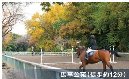
馬事公苑 (徒歩約12分)