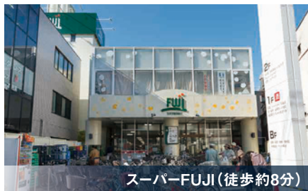
スーパーFUJI (徒歩約8分)