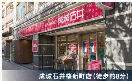
成城石井桜新町店 (徒歩約8分)