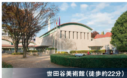
世田谷美術館 (徒歩約22分)