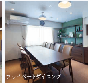
プライベートダイニング