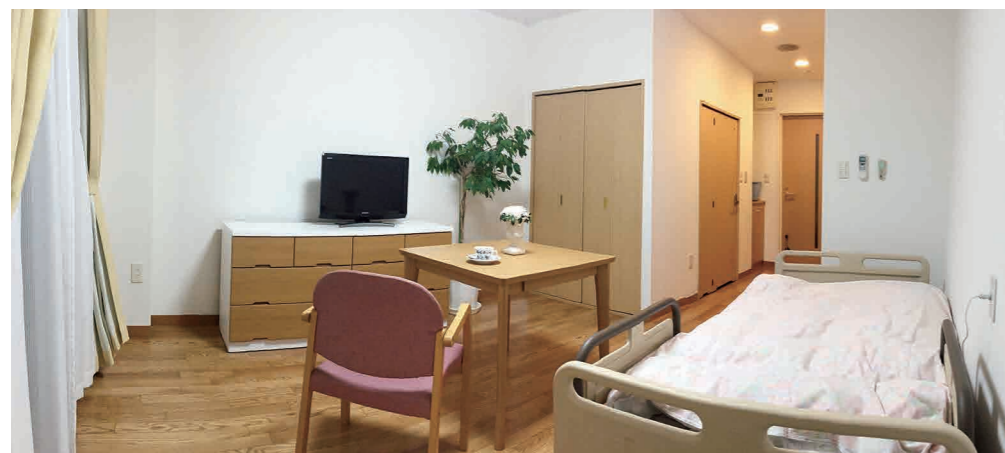
居室(モデルルーム)

全室キッチン・トイレ・収納完備。平均23㎡超のゆとりの住空間。浴室を設置したお部屋もご用意しています。