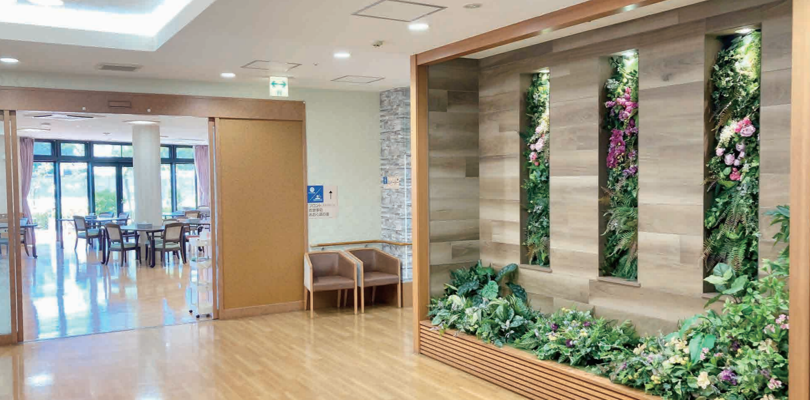
清潔でゆとりあふれるエントランスロビー