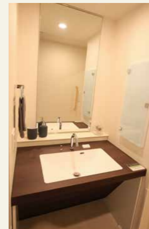
洗面台 (温水) 車いすの方もご利用しやすい設計の洗面台です。