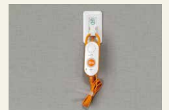
ナースコール ベッドの横に設置しているので、いざという時も安心です。