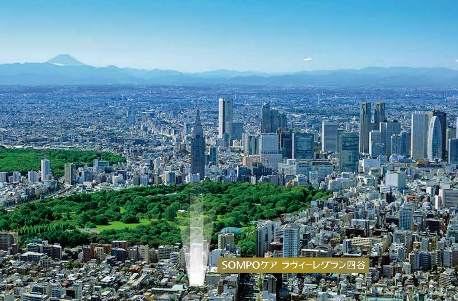
SOMPOケア ラヴィーレグラン四谷