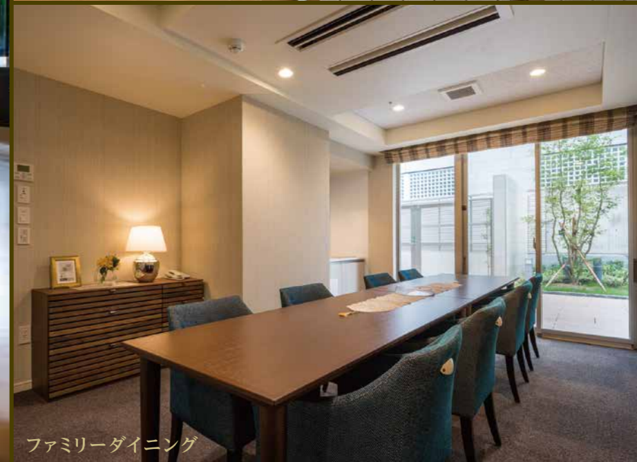
ファミリーダイニング