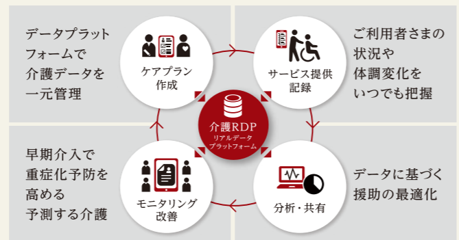
SOMPOケアのケアマネジメントサイクル

ご利用者さまの健康状態からスタッフの活動状況まで、あらゆる情報をデータ化し集約。高品質なケアの提供やスタッフの業務負担軽減のほか、ホーム・事業所運営の効率化を進めています。