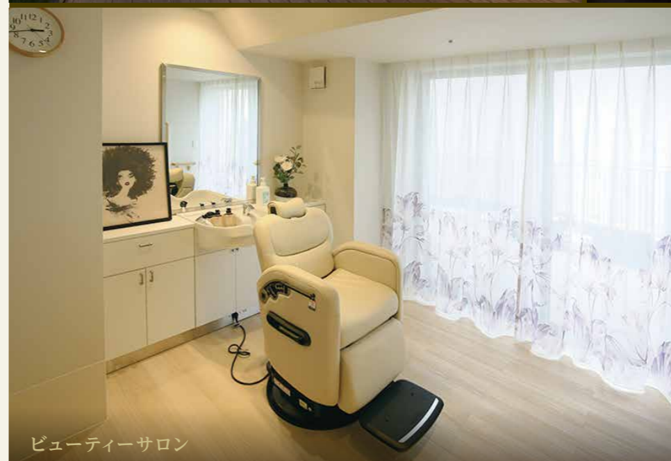
ビューティーサロン