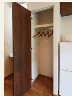
クローゼット 高さとお行きがあるので、収納力が豊富な物入。