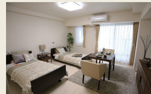
ご夫婦でお過ごしいただけるお二人さま用の居室