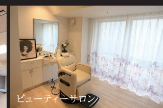
ビューティーサロン