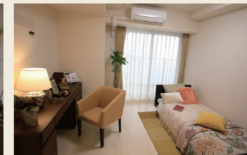
全室トイレ・収納完備による「暮らしやすさ」に配慮した住空間