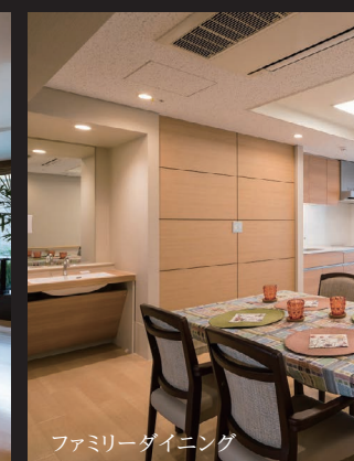
ファミリーダイニング