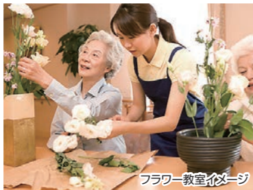
フラワー教室イメージ