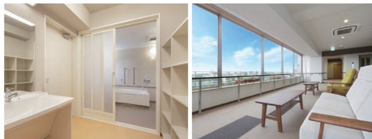
広くて清潔な共同浴室(各階)