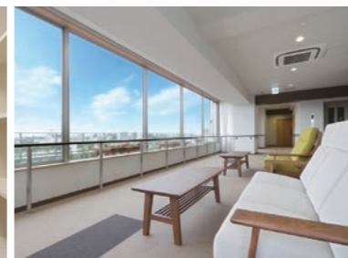
眺めのいい開放感のある談話コーナー(6F)