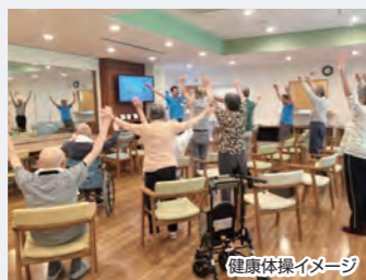
健康体操イメージ