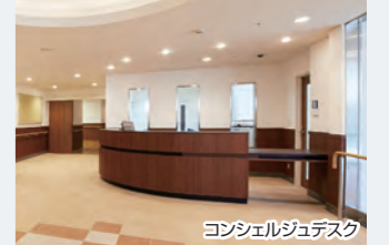
コンシェルジュデスク

土をじかに突き固めることにより、長年積み重ねてきた地層のような、美しい独特の表情が現れる伝統工法。古来、法隆寺や薬師寺でも使用された。マンダリンオリエンタル東京も手掛けた新進気鋭の職人集団「(有)ぬり貫」の作品。