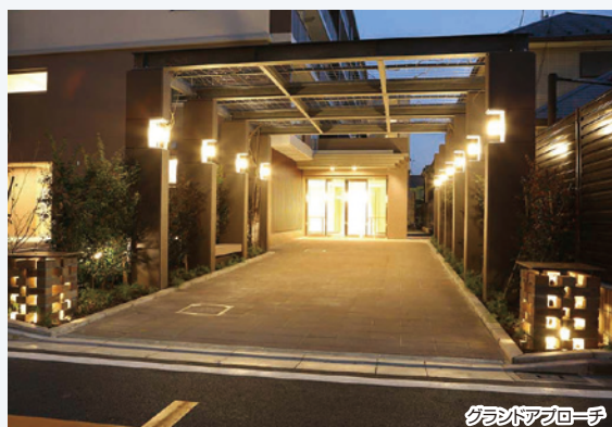
グラントアプローチ

ふじみ野市の有形文化財である「苗間神明社の常夜灯」をモチーフに造形された灯籠型門柱