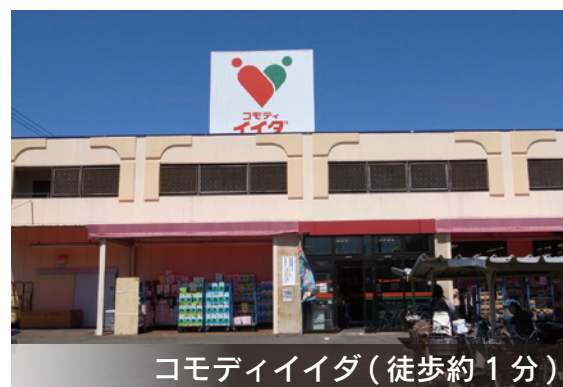
コモディイイダ(徒歩約1分)