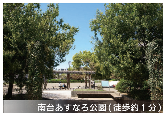
南台あすなろ公園(徒歩約1分)