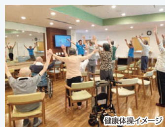
健康体操イメージ