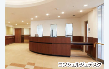
コンシェルジュデスク

土をじかに突き固めることにより、長年積み重ねてきた地層のような、美しい独特の表情が現れる伝統工法。古来、法隆寺や薬師寺でも使用された。マンダリンオリエンタル東京も手掛けた新進気鋭の職人集団「(有)ぬり貫」の作品。