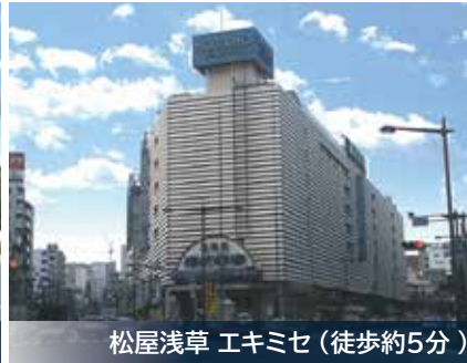
松屋浅草 エキミセ（徒歩約5分）