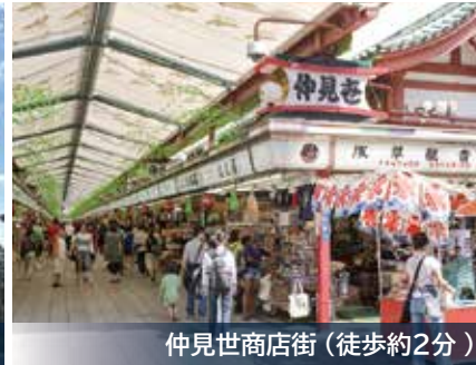
仲見世商店街（徒歩約2分）