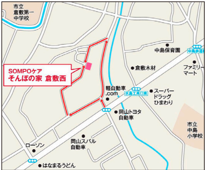
〒710-0803 岡山県倉敷市中島1216-1 (地図アプリ等で検索する場合は、岡山県倉敷市中島1037-2を検索してください。)

山陽本線「西阿知」駅下車、すぐの道を左折約30mほど進むと左手に地下歩道があるためそちらへ進む。地下道を抜けましたら、水島工業高校・倉敷第一中学校の間を進み、突当りを左折。約100m程度進み、右手の細い路地に入り、すぐ左折約100m程度進み突当りを右折。約100m程度進みへ左折。突当りを左折。道なりに約200m程度進み、右折すると4階建ての建物がホームです。