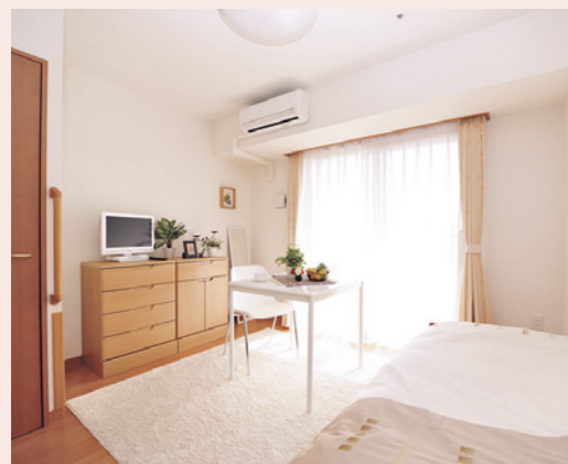
自分らしくのびのびと過ごせる居室

お気に入りの家具や使い慣れた電化製品を持ち込んでいただき、ご自分らしいインテリアで楽しんでいただける居室。おひとりでゆっくり楽しむ時間も、まるでわが家のようにお過ごしいただけます。