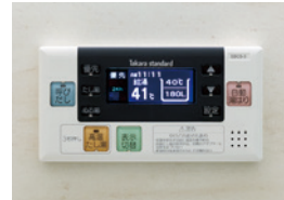
浴室給湯リモコン