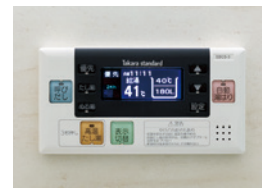
浴室給湯リモコン