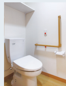
バリアフリー設計の ゆとりあるトイレ