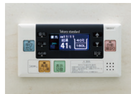
浴室給湯リモコン