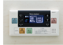
浴室給湯リモコン