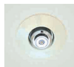
【スプリンクラー】 (消防法に基づき標準装備)