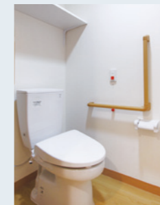
バリアフリー設計の ゆとりあるトイレ