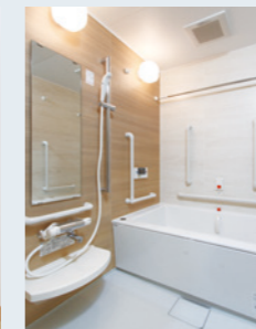
手すりが適切に 付けられている浴室