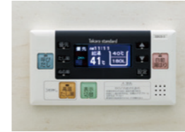
浴室給湯リモコン