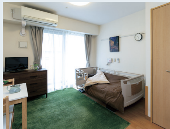
お好みの家具を持ち込むことができる住空間

開き戸の玄関がある居室は、さながらワンルームの賃貸マンション。シニアに優しい設備や機能も備った、自由に安心して暮らせる“我が家”です。