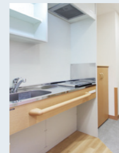
料理が楽しめる IHキッチン

※一部、居室内の設備や間取り等が異なる場合がございます。予めご了承ください。詳しくは、介護なんでも相談室までお問い合わせください。