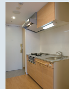
料理が楽しめる キッチン

※一部、居室内の設備や間取り等が異なる場合がございます。予めご了承ください。詳しくは、介護なんでも相談室までお問い合わせください。