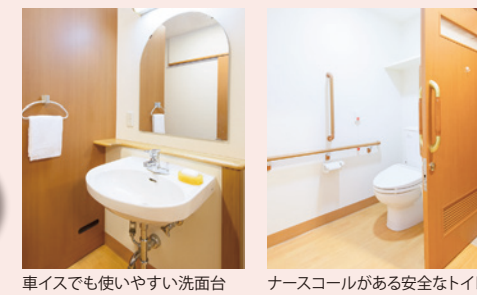
車イスでも使いやすい洗面台 ナースコールがある安全なトイレ