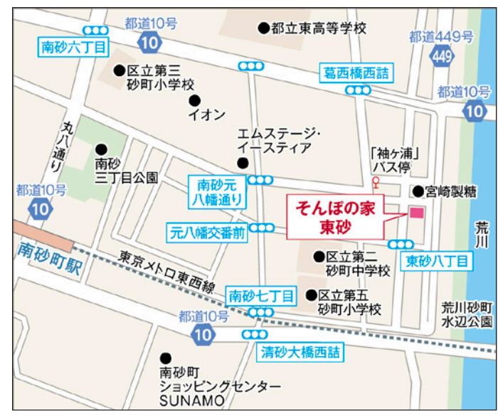
〒136-0074 東京都江東区東砂8-22-6

地下鉄東西線「南砂町」駅より徒歩約15分。 地下鉄東西線「南砂町」駅2a口より、南砂三丁目公園を抜けて元八幡通りに向かい、元八幡通りに出たら、右折し道なりに約700m進むと四十町通りに。クランクになっている交差点も直進し、約150mほど進むと右手側がホーム。