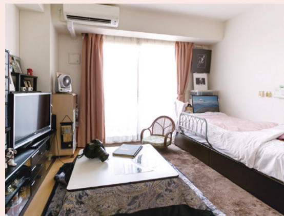
自分らしくのびのびと過ごせる居室

ご自宅で過ごすのと同じような環境づくりを大切にしたい個室仕様の“住まい”が、これまでと変わらない、ありのまま暮らす日々を叶えます。