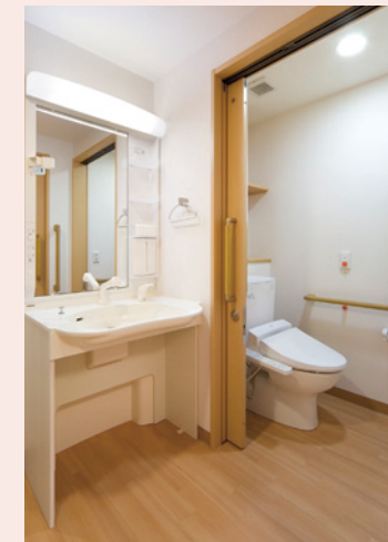
車椅子でも使いやすい トイレと洗面台