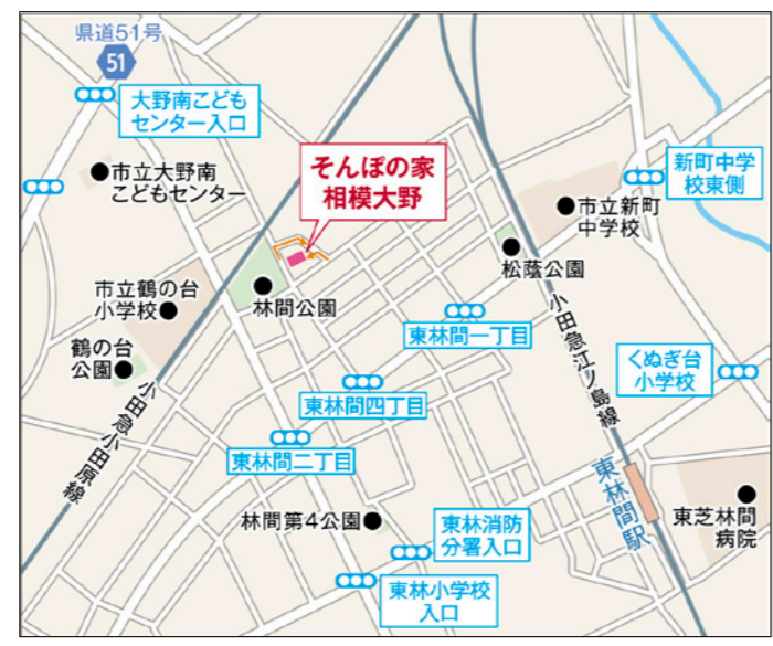
〒252-0311 神奈川県相模原市南区東林間1-21-2