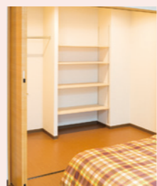
大容量の収納スペース