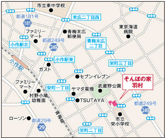
〒205-0002 東京都羽村市栄町2-6-4

【そんぽの家】共通施設概要 ●居室設備:エアコン、温水洗浄機能付トイレ、洗面台、収納スペース、緊急コール、テレビ配線、電話回線、ミニキッチン(一部のみ) ●共用設備:ダイニング(食堂)兼 機能訓練コーナー、浴室(個別・特殊浴)、洗濯室、トイレ、浴室・トイレにナースコール、他 ●入居対象:原則65歳以上の方、介護保険受給認定を受けている方 ●類型:介護付有料老人ホーム(一般型特定施設入居者生活介護) ●土地の建物の所有形態:事業主体非所有 ●居住の権利形態:利用権方式 ●利用料の支払い方法:月払い方式 ●介護保険:特定施設入居者生活介護・介護予防特定施設入居者生活介護 ●介護居室区分:全室個室 ●介護にかかわる職員体制:要介護者の合計人数:配置直接処遇スタッフの人数=3.0:1以上 ※週40時間の常勤換算