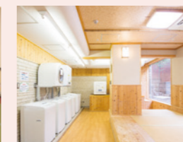
洗濯機6台乾燥機5台完備の洗濯室(無料)