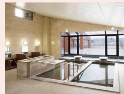
展望風呂「富士見の湯」

四季の移ろいを感じられる大きな中庭や天気の良い日は遠くに富士山が顔を覗かせる展望風呂が魅力の「そんぽの家 羽村」。古き良き昭和の雰囲気漂う本館は、安らぎとくつろぎのひと時を提供できる多彩なスペースがあり、日々の暮らしを彩ります。