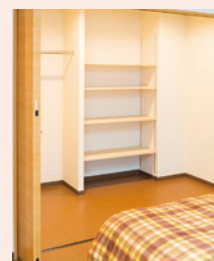
大容量の収納スペース