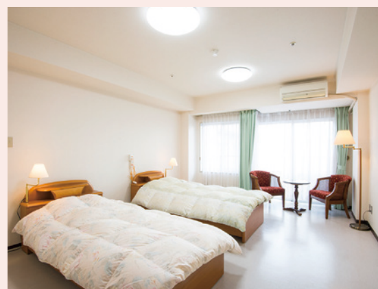
自分らしくのびのびと過ごせる居室

約35㎡～最大約48.6㎡の広々とした居室で、すべてのお部屋で2名さままでのご入居が可能です。ご夫婦やご家族、自立の方もご入居いただけますので、今までのライフスタイルそのままにお過ごしいただけます。