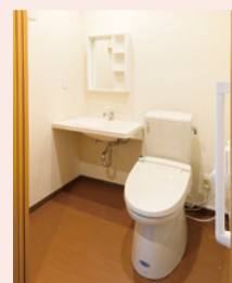
車イスでも使いやすいトイレ