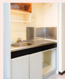
生活に便利なキッチン