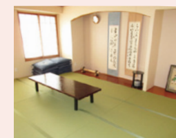
ご家族さま用の宿泊部屋(無料)