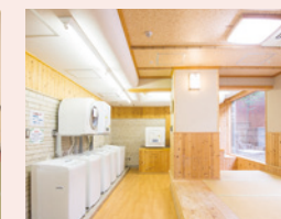
洗濯機6台乾燥機5台完備の洗濯室(無料)