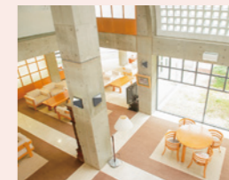
広々とした吹き抜けのロビー