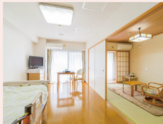
自分らしくのびのびと過ごせる居室

約33㎡~最大約84㎡の広々とした居室で、すべてのお部屋で2名さままでのご入居が可能です。ご夫婦やご家族、自立の方もご入居いただけますので、今までのライフスタイルそのままにお過ごしいただけます。 ※居室内の設備や間取りは、各居室によって異なります。