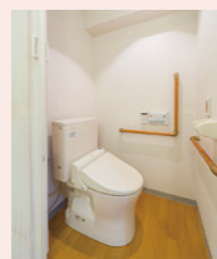
車イスでも使いやすいトイレ