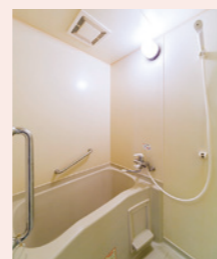
手すりのある浴室