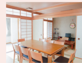
ご家族さま用の宿泊部屋(宿泊料無料)