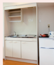
生活に便利なキッチン

約33㎡~最大約84㎡の広々とした居室で、すべてのお部屋で2名さままでのご入居が可能です。ご夫婦やご家族、自立の方もご入居いただけますので、今までのライフスタイルそのままにお過ごしいただけます。 ※居室内の設備や間取りは、各居室によって異なります。