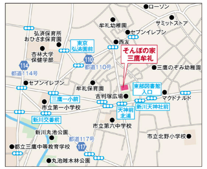
〒181-0002 東京都三鷹市牟礼7-1-2