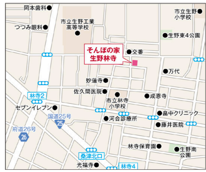
〒544-0023 大阪府大阪市生野区林寺3-1-15

阪神高速「天王寺ランプ」から車で約300m→「天王寺」駅前の交差点を直進→約700m先「寺田町」交差点を右折→約500m「林寺2」交差点を左折→次の信号をすぐ右折→3つ目の信号を左折→約200m直進→右手がホーム。